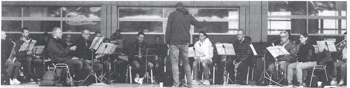
Eine ganz und gar unkonventionelle Probe: Um mit allen Registern gemeinsam Corona-konform spielen zu können, finden die Proben in der offenen Halle des Strassenverkehrsamtes Bassersdorf statt.