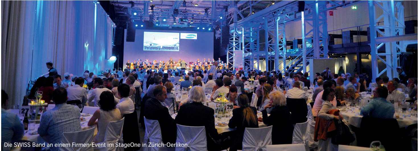
Die SWISS Band an einem Firmen-Event im StageOne in Zürich-Oerlikon.