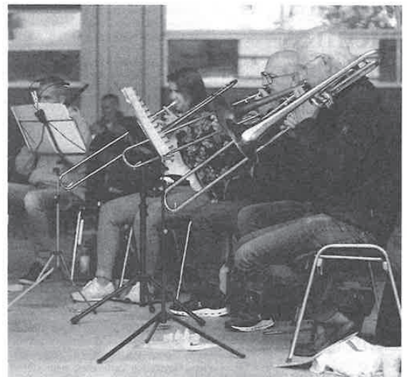
Trotz Zwangspause hat jeder der Swiss-Band-Musiker weiter fleissig geübt.