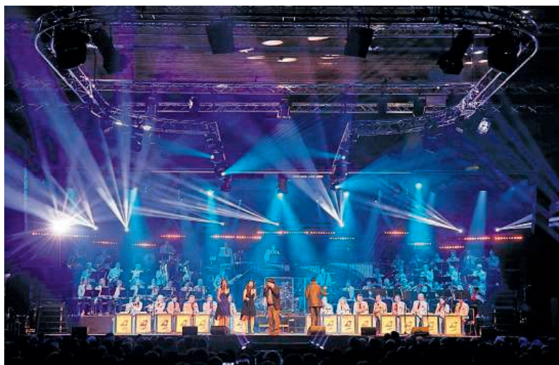
Neue Lightshow, neuer Bandleader, neue Musikstile: Die Swiss Band zeigte bei ihrem Auftritt am Mittwoch in der Bülacher Stadthalle, wie sie in Zukunft auch ein jüngeres Publikum begeistern will.

Swiss Band in Concert: Tickets für Freitag und Samstag sind erhältlich unter www.swiss-band.ch oder an der Abendkasse. Türöffnung in der Stadthalle Bülach ist jeweils um 18.30 Uhr, Konzertbeginn um 19.30 Uhr.