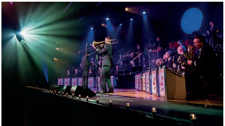
Immer wieder gaben Musiker des Orchesters eine Solonummer zum Besten.