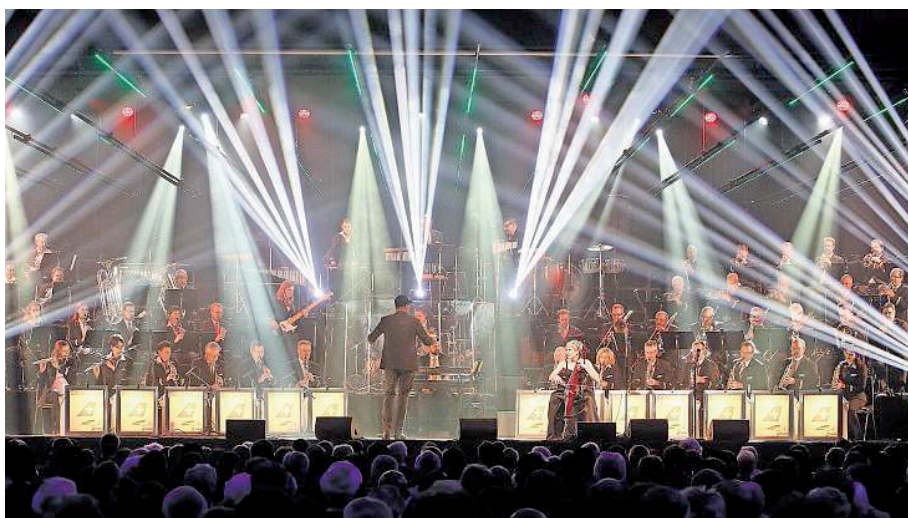
Über 550 Gäste lockte die Swiss Band alleine am Mittwoch mit ihrem Konzert in die Stadthalle Bülach.